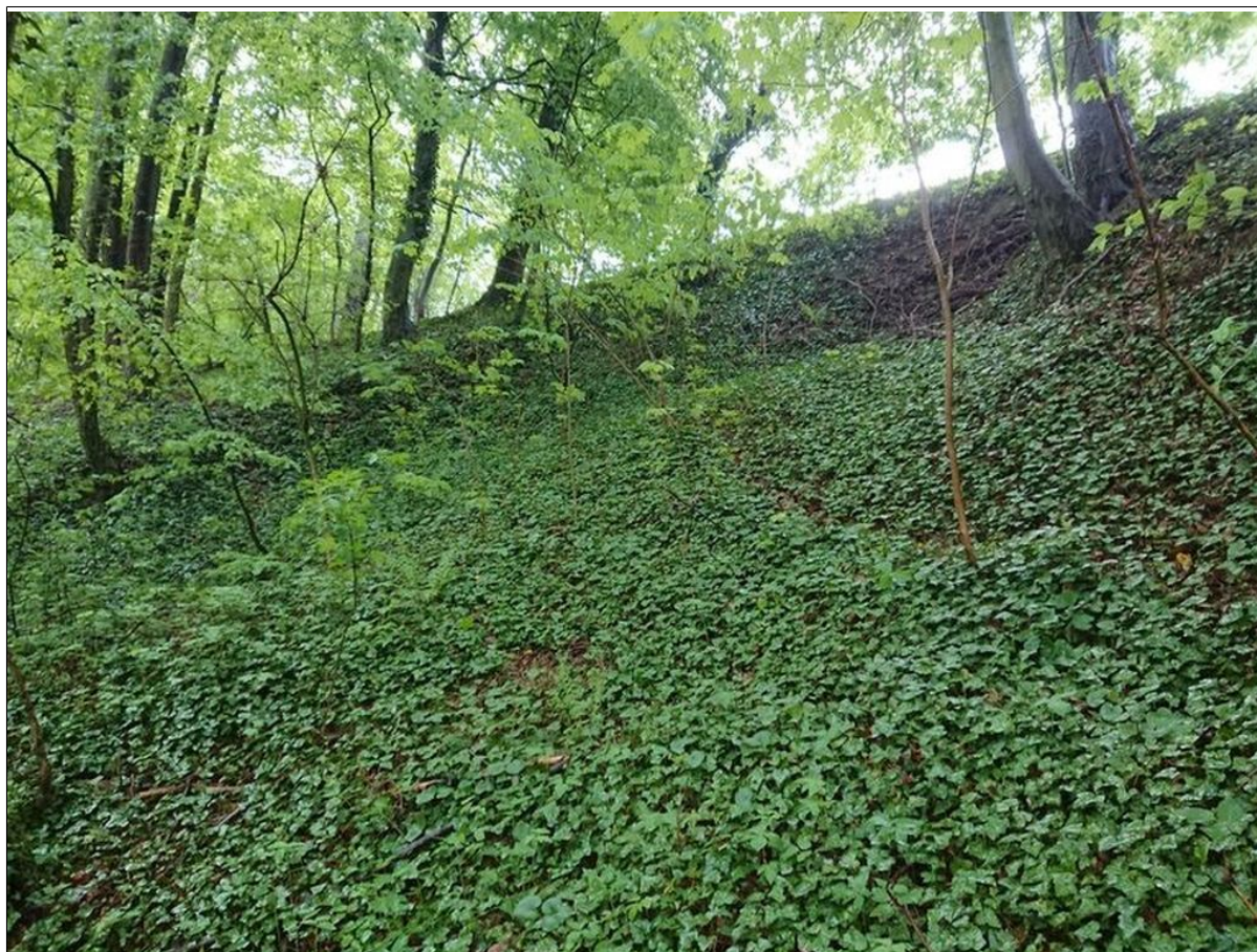
Skarpa górna osuwiska.