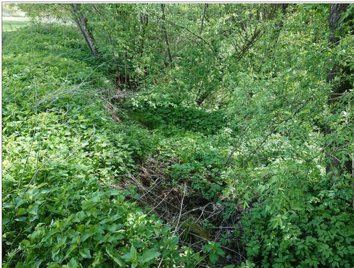
Skarpa górna osuwiska.