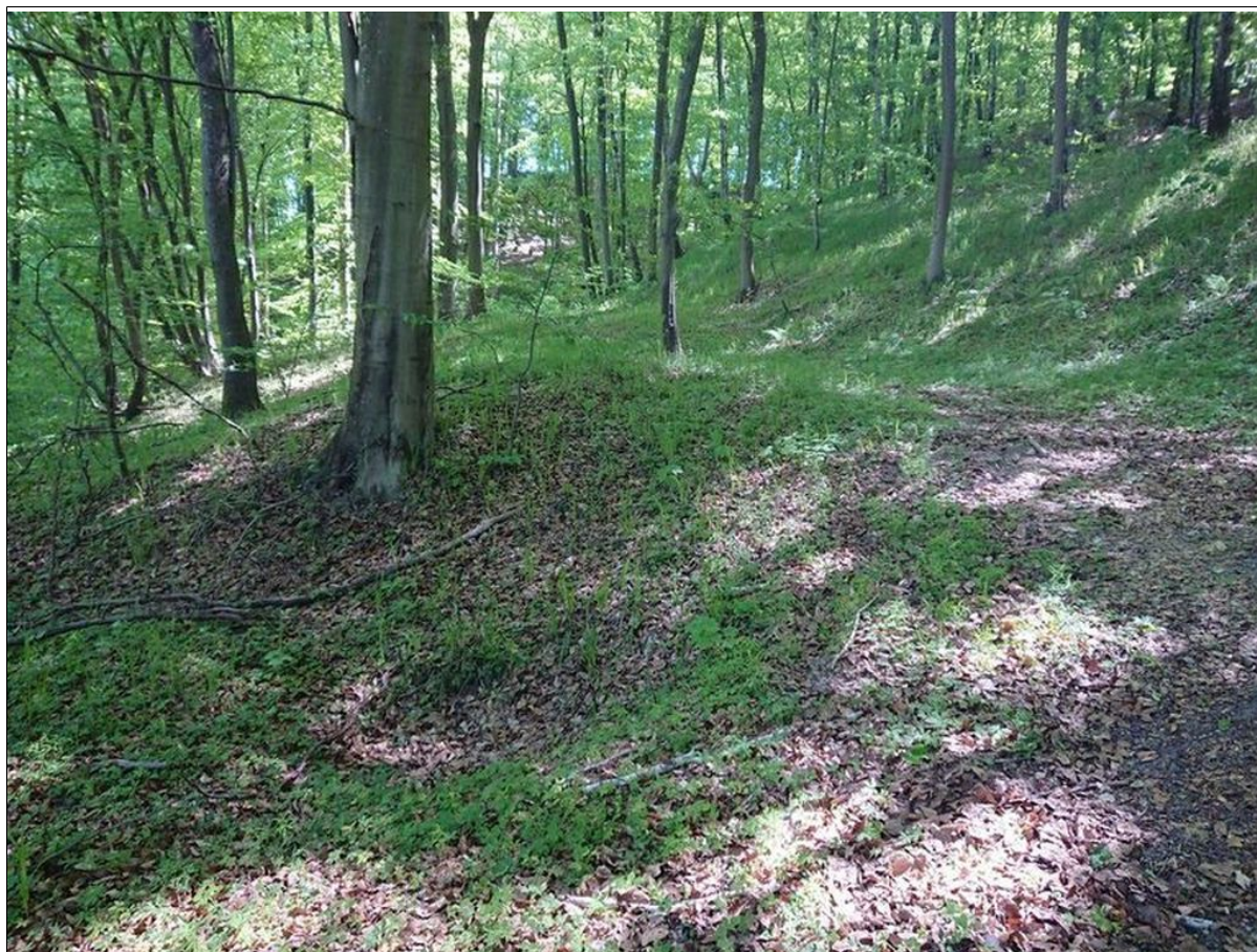
Widok powierzchni koluwialnej.