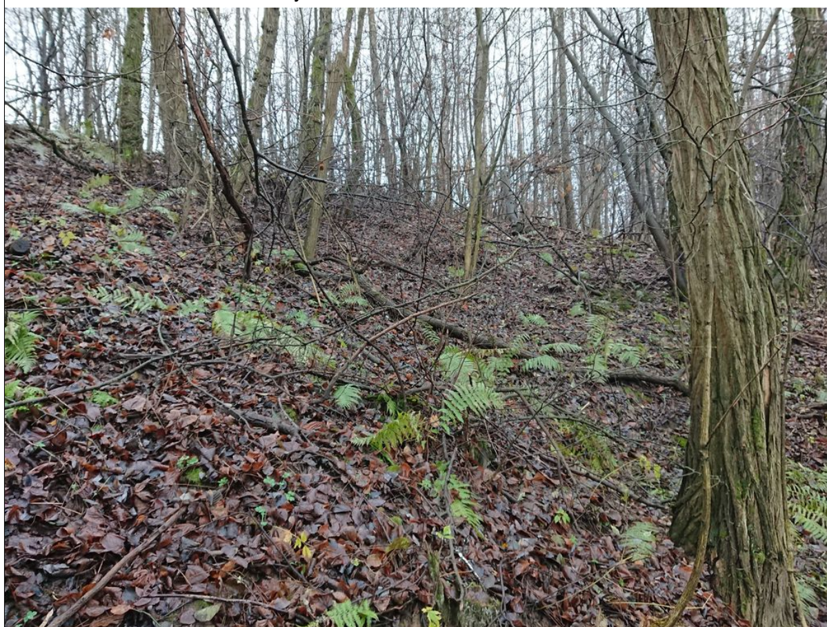
Powierzchnia koluwalna, w tle skarpa górna.