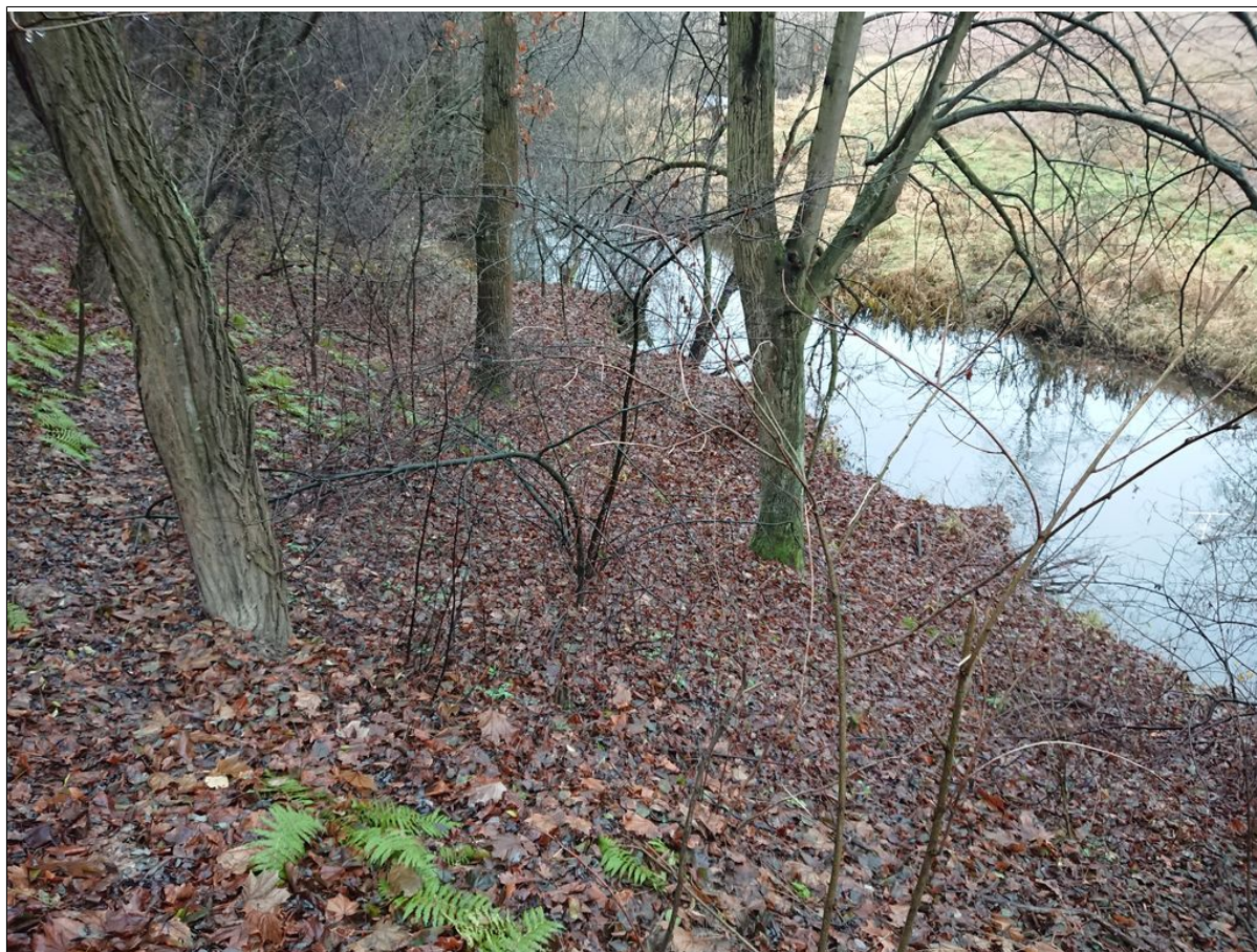
Powierzchnia koluwalna nad korytem Kacanki.