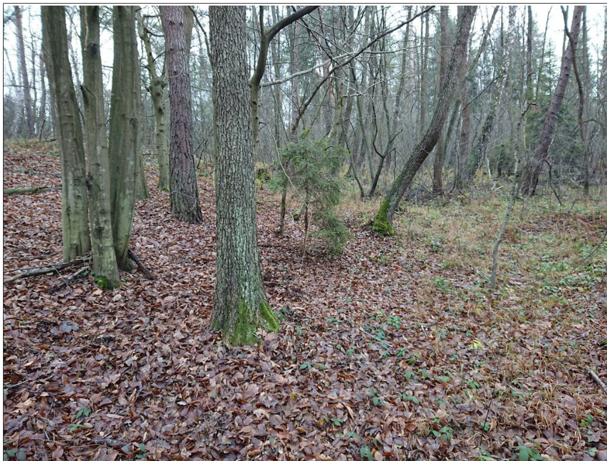
Skarpa górna osuwiska.