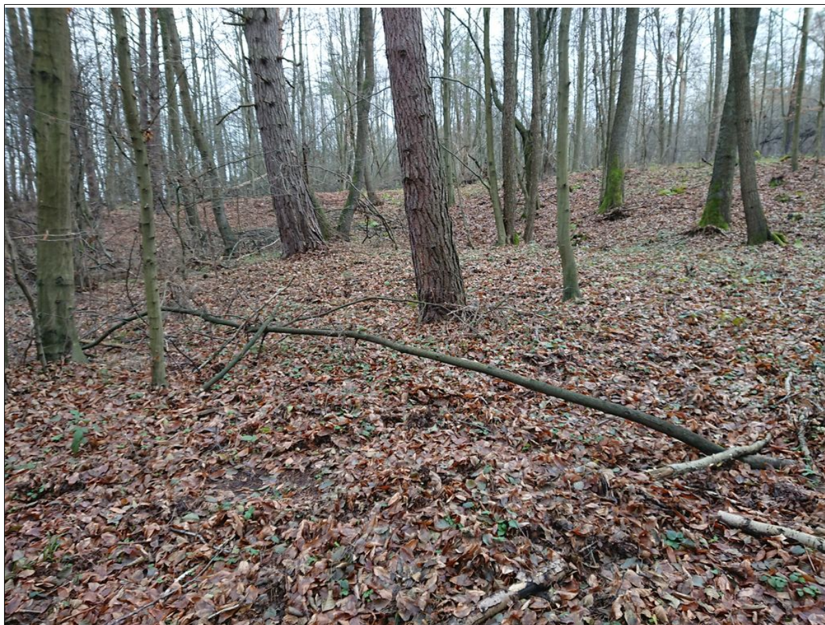
Skarpa górna osuwiska.