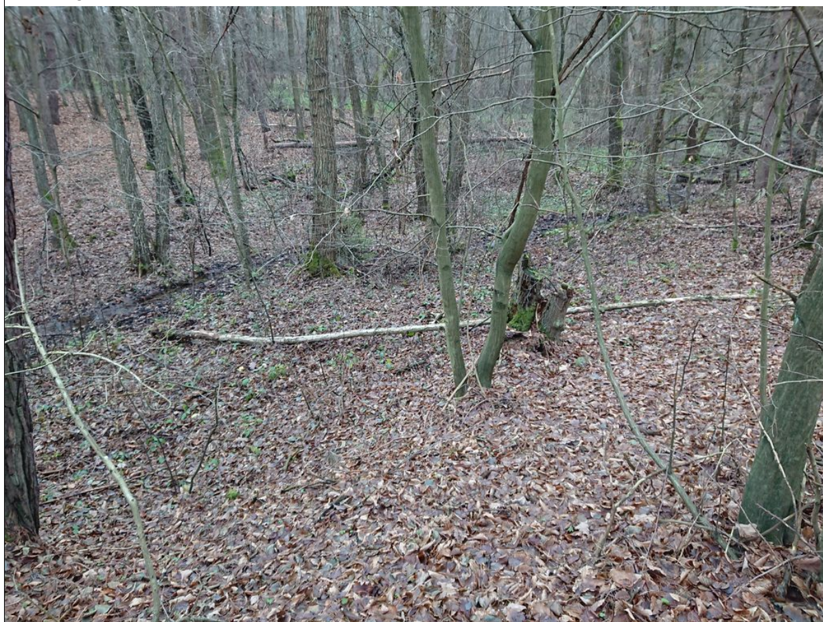
Czoło osuwiska zaciskające potok.