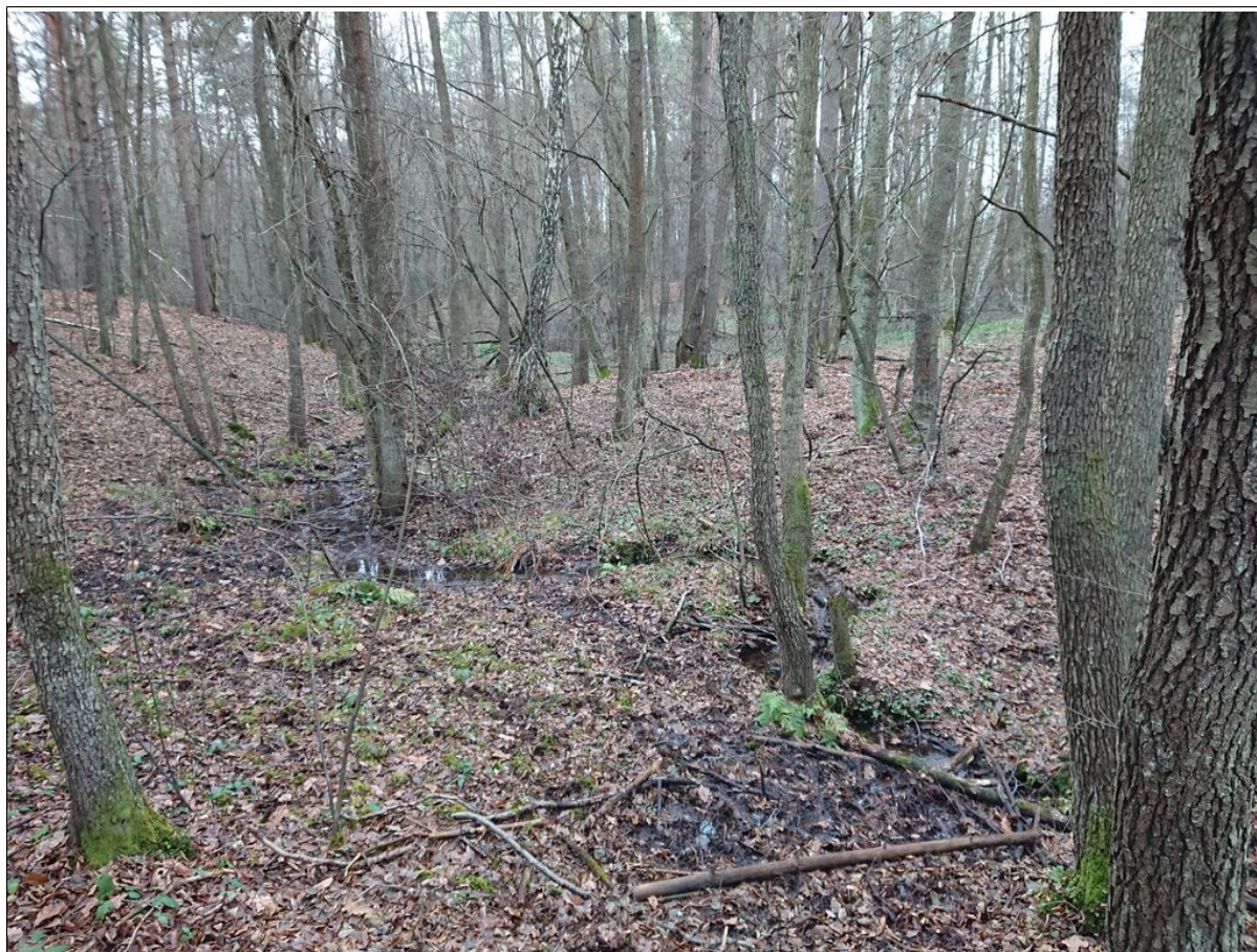
Wysięk u czoła osuwiska.