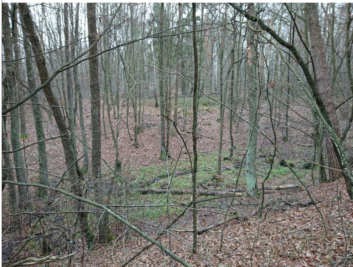
Fragment powierzchni koluwalnej.