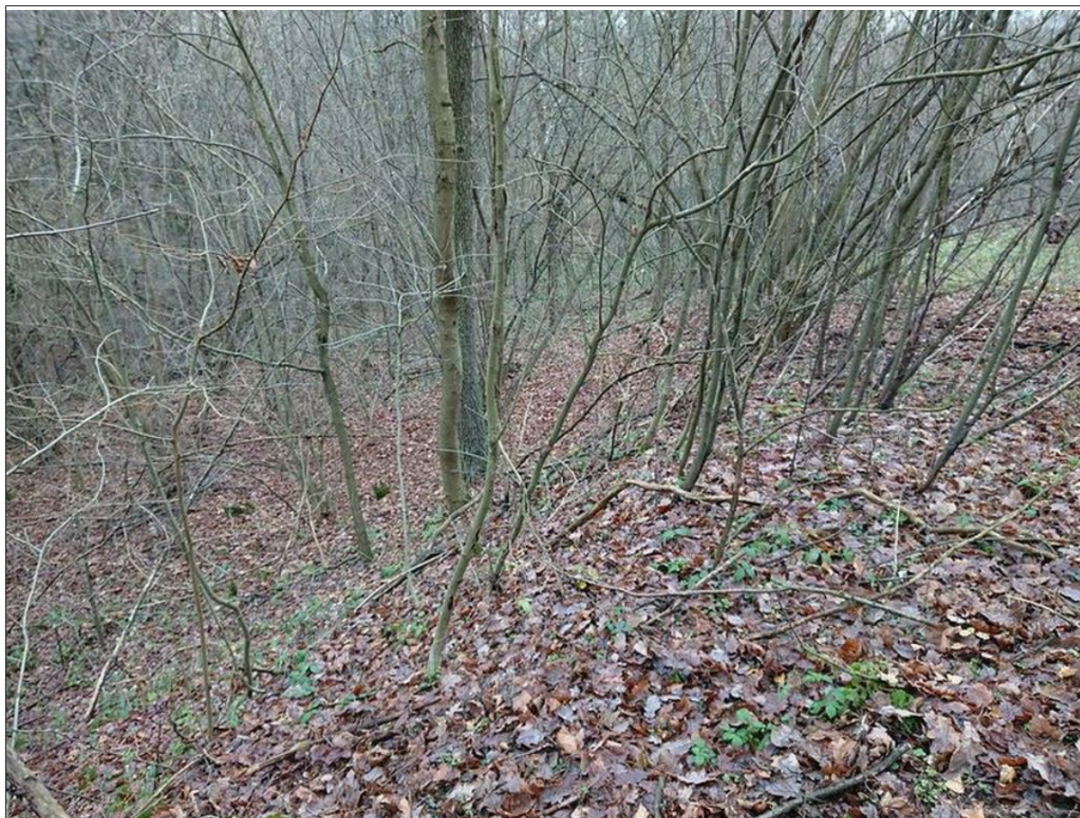
Widok z nad skarpy górnej osuwiska.